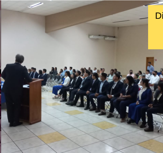
Diplomado en Genética y Medicina Molecular Evento de Clausura 2023