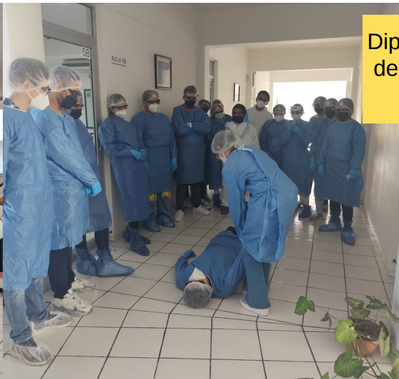
Diplomado de Urgencias en Medicina de Primer Contacto, 2da generación Evento de Clausura 2023