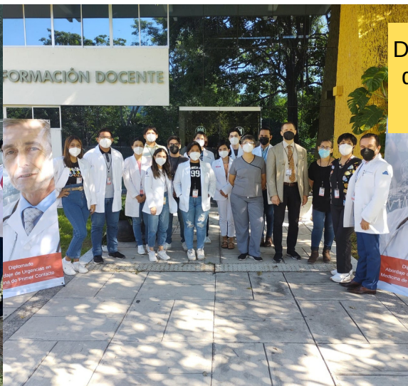
Diplomado de Urgencias en Medicina de Primer Contacto, 1ra generación Evento de Clausura 2022